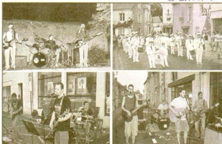
De gauche à droite et de haut en bas : Pink Lady, la fanfare le Réveil saumurois, Alvm et Yahan ont animé la fête de la musique montreuillaise

La fanfare a donné le signal en partant des Nobis (à l'inverse de ce qui était annoncé), et a défilé joyeusement pendant que les groupes donnaient leur numéro sur les podiums installés en ville. La foule nonchalante passait, puis s'arrêtait si les rythmes lui plaisaient avec des escales aux buvettes et bars dans la plus grande convivialité.