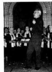
La chorale Diapason a fait vibrer l'église de Saint-Georges-du-Bois.