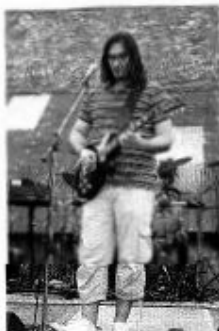
Le décor n'a pas d'importance : ce joueur de guitar a tout le loisir d'exprimer son potentiel.