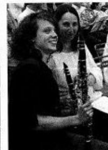
Stressées ces dames avant la représentation ? Pas vraiment !