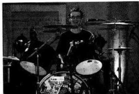
Le batteur des Vandal Hearts est particulièrement ébouffant.