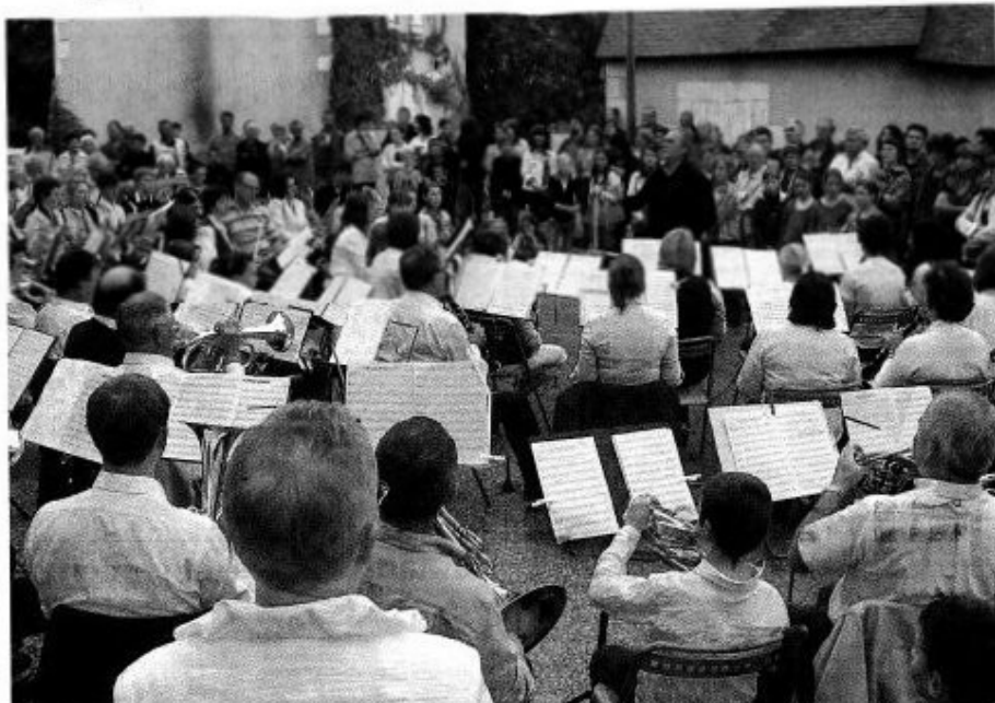
Réunis, les harmonies de Beaufort et de Mazé ainsi que l'orchestre des Jeunes constitue un ensemble de 100 musiciens : le public a apprécié leur prestation.