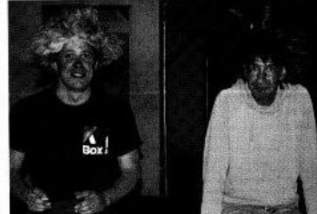
Les Pink Lady ne sont certainement pas étrangers à cette transformation capotaine !