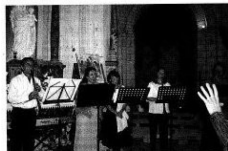
La main impose le tempo, les clarinettes et les voix s'efforcent au mieux de le suivre.

Les amateurs de musiques du secteur ont convergé hier soir vers Saint-Georges-du-Bois. Et comme la pluie a eu la très bonne idée de ne pas s'inviter au bal des petites notes, la manifestation a plutôt connu une bonne fréquentation, même s'il est toujours illusoire de vouloir en faire un chiffre précis.