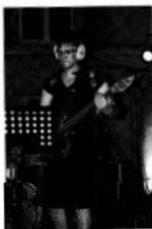
Le moins que l'on puisse dire, c'est que les Pink Lady et son sexy punk ne passent pas inaperçus.