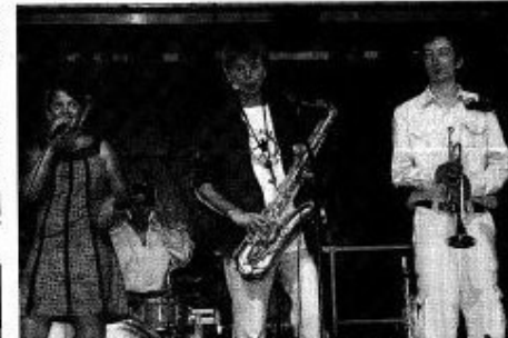
Les Milestones ont joué du jazz et du blues : c'était un des trois groupes en lice pour le Tremplin de la Bosse.